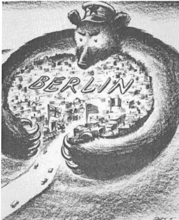
Le blocus de Berlin, caricature américaine de Dick Spencer publiée en juin 1948 dans le journal Saint Louis Post Dispatch.