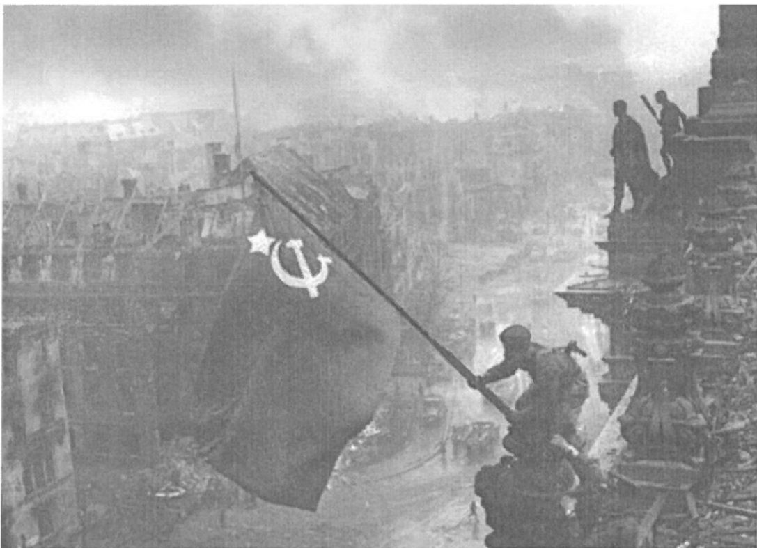
Le drapeau soviétique flottant sur les toits du Reichstag (2 mai 1945).