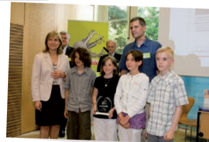
Prix spécial de la Déléguée interministérielle à la Sécurité routière Ecole primaire Paul Langevin Mondeville (Calvados)