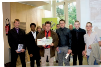
Catégorie "Collège" Établissement régional d'enseignement adapté (EREA) François Truffaut Mainvilliers (Eure et Loire)