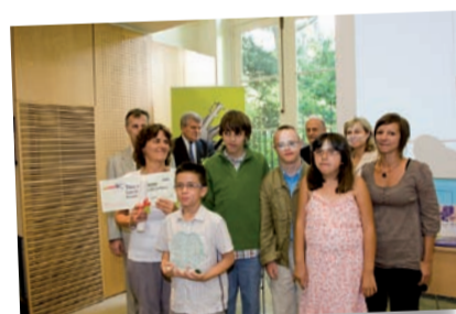
Prix spécial de la Fédération française des sociétés d'assurances (FFSA) Institut médico-éducatif (IME) Les Oliviers Montpellier (Hérault)