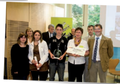
Catégorie "Lycée" Lycée professionnel privé Nazareth Ruillé-Sur-Loir (Sarthe)