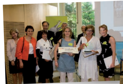
Catégorie "Ecole - Cycles 1&2" Ecole d'application Joliot Curie Charleville-Mézières (Ardennes)