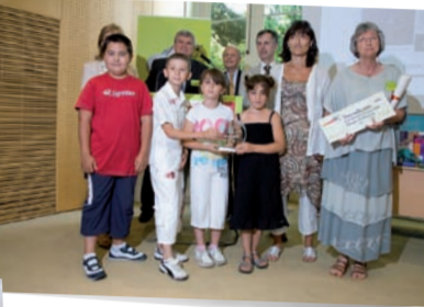
Catégorie "Ecole - Cycle 3" Ecole élémentaire Françoise Dolto Villeneuve-Lès-Maguelonne (Hérault)