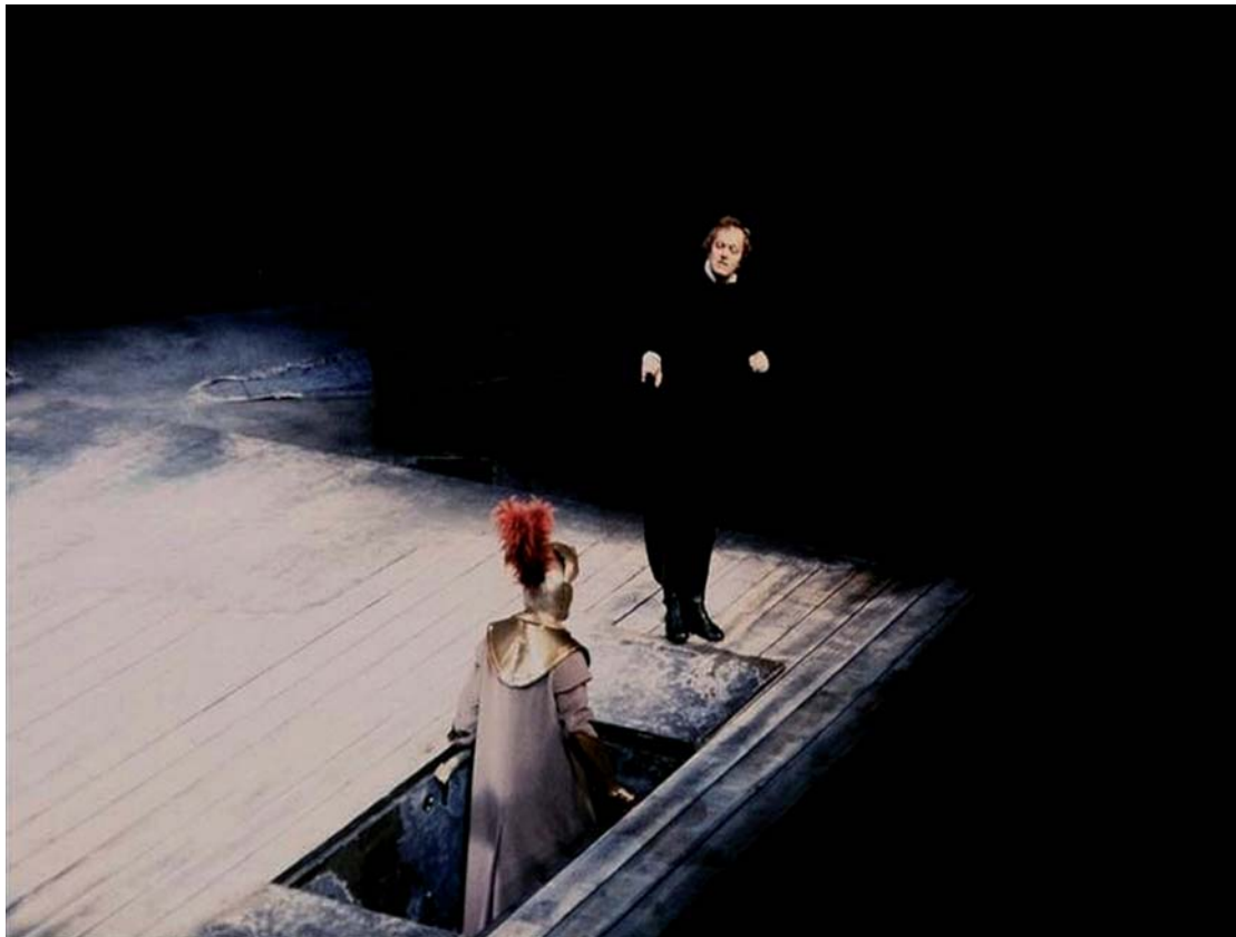
Hamlet de Shakespeare, mise en scène de John Barton, Royal Shakespeare Company, 1980. De gauche à droite : le spectre et Hamlet.