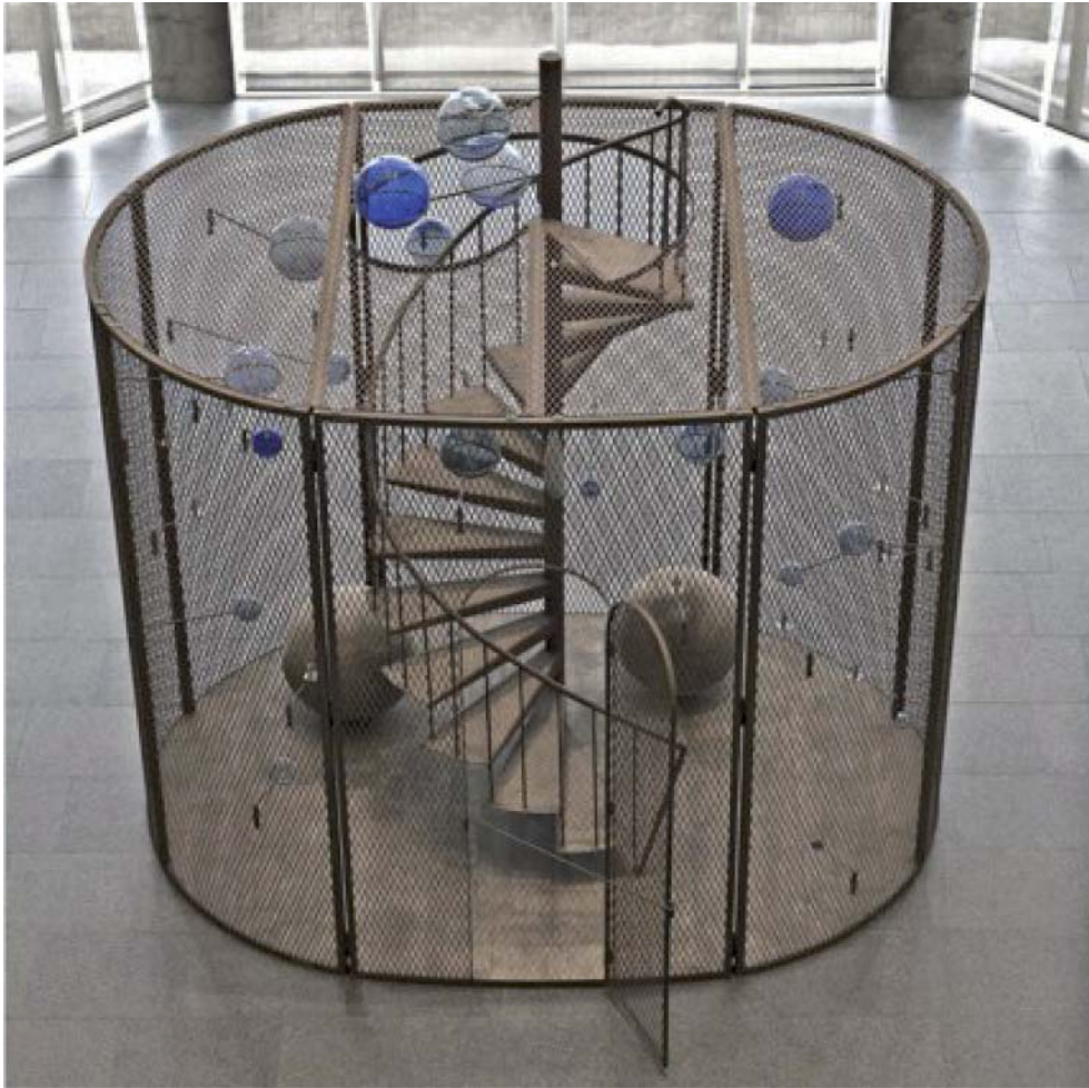
Cellule (La dernière montée) , Louise Bourgeois, 2008, technique mixte (acier, bois, verre soufflé, caoutchouc, et bobine de fil), 384,8 x 400,1 x 299,7 cm installé, Musée des Beaux-Arts du Canada, Ottawa.