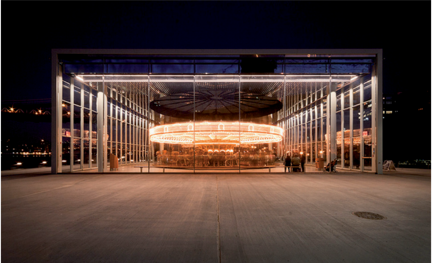
Jane's Carousel Pavilion , Jean Nouvel, 2011, Brooklyn Bridge Park/Empire Fulton Ferry State Park, photographie Hassan Bagheri.