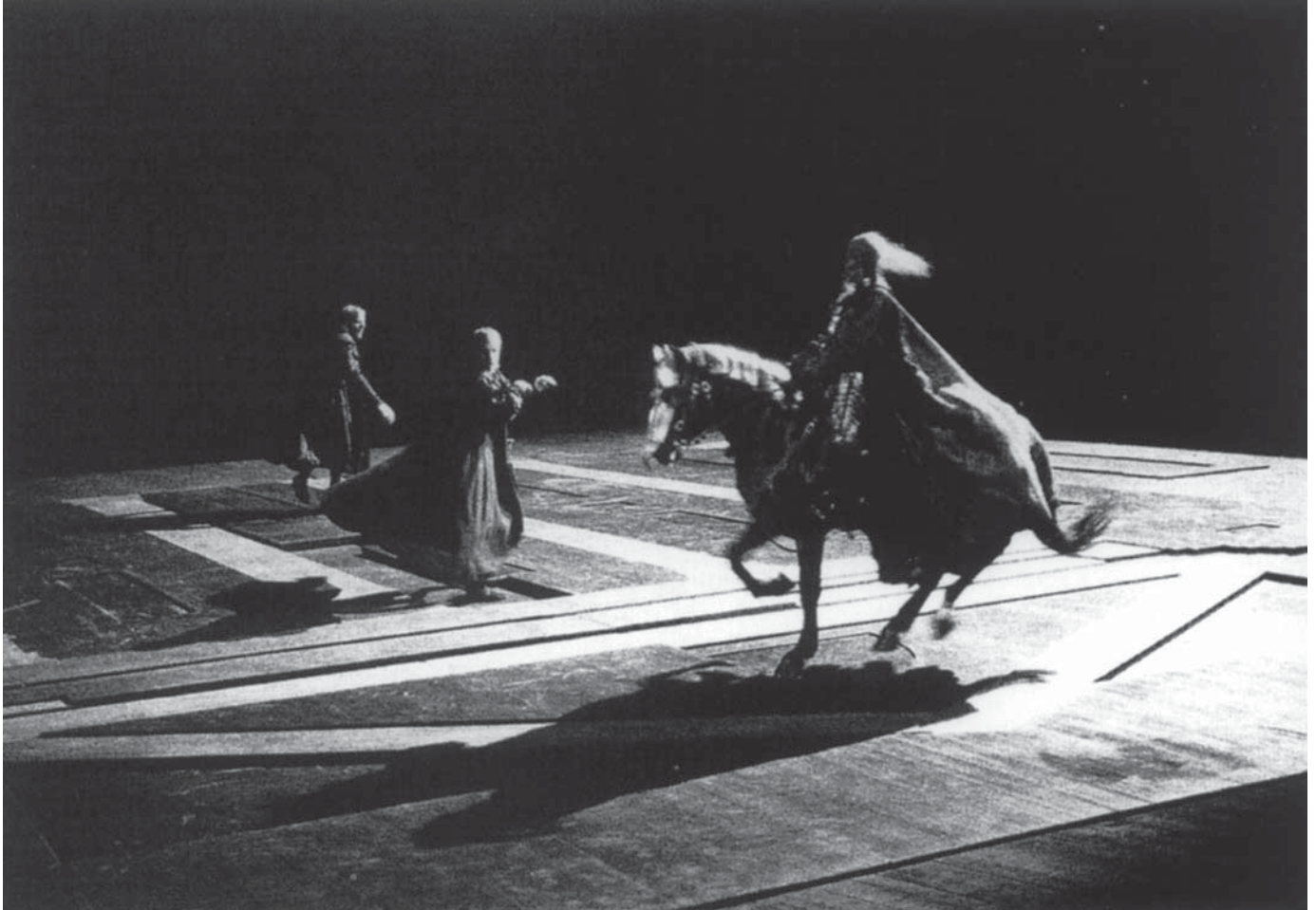
Hamlet de Shakespeare, mise en scène de Patrice Chéreau, Cour d'honneur du Palais des Papes, Avignon, 1988. De gauche à droite : Horatio, Hamlet et le spectre.