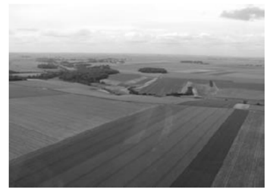
Vue des plaines de la Beauce (Bassin parisien)