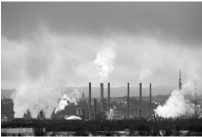
Vue du site de Feyzin (vallée du Rhône)

3. Reliez chacune des photographies à l'espace auquel elle correspond. (1,5 point)