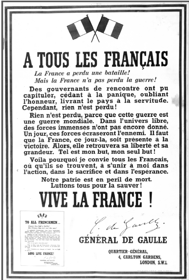
Affiche publiée en juillet 1940.

1. Nommez l'auteur du message délivré par cette affiche.