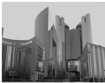
Vue de la Défense (Île-de-France)