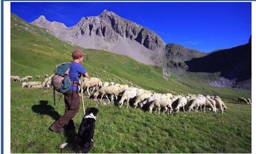
N° ..... Élevage de brebis dans les Alpes