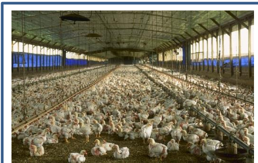
N° ..... Élevage de poulets en Bretagne