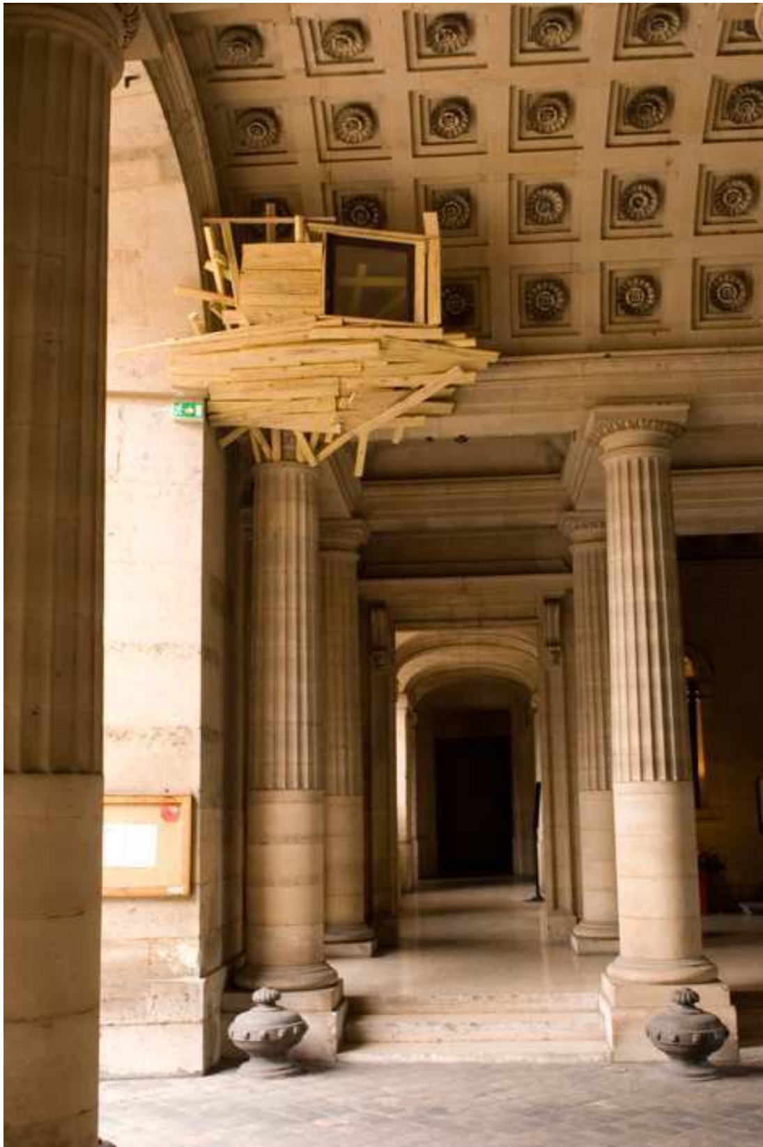
Tadashi, KAWAMATA, Tree Huts , bois, 2008. Installation in situ réalisée dans l'hôtel de la Monnaie, Paris, France.