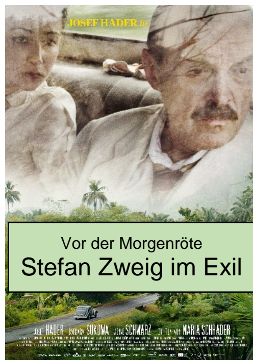
nach einem Filmplakat von 2016