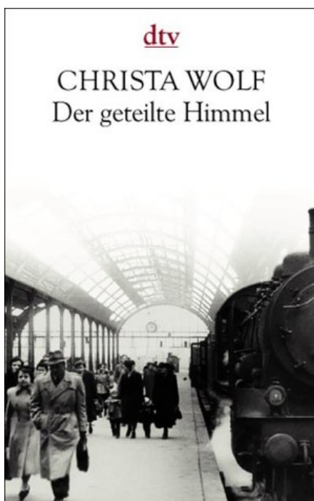
Buch von Christa Wolf (erschienen 1963)

Warum wird das Thema "Exil" in Filmen, in der Literatur und in der Malerei so oft behandelt? Und wie wird es dargestellt? Argumentieren Sie und geben Sie Beispiele. Sie können sich eventuell von folgenden Abbildungen inspirieren lassen.