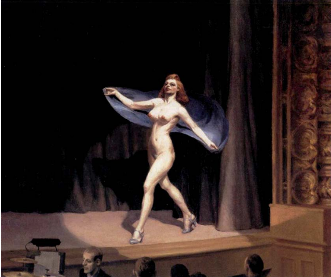
Edward Hopper, Girlie show (Strip-tease) , 1941, huile sur toile, 81,3 x 96,5 cm, collection particulière.