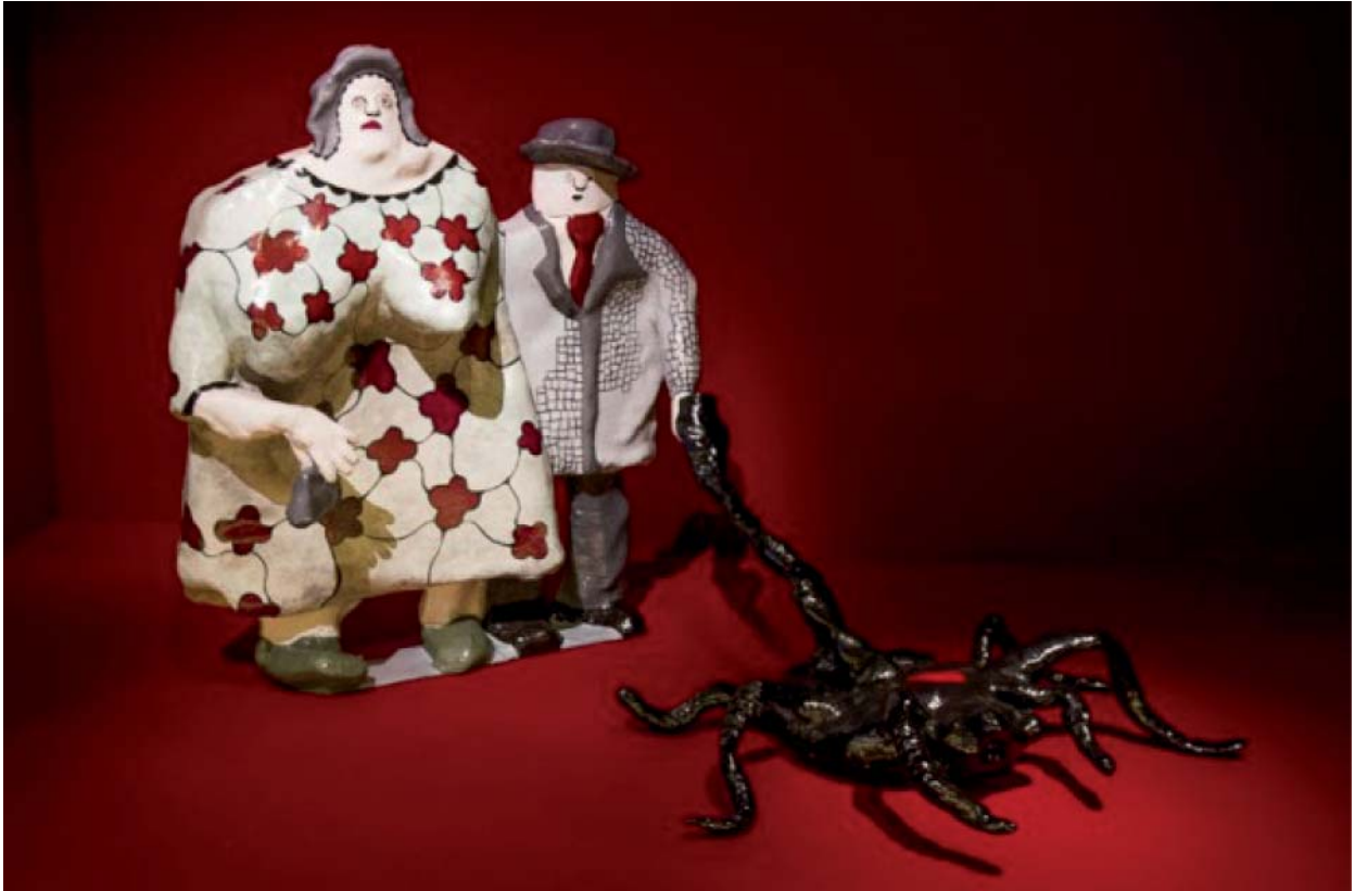
Niki de Saint Phalle, La Promenade du dimanche , 1971, 185 x 215 x 200 cm, polyester peint, Niki Charitable Art Foundation, Santee, USA.