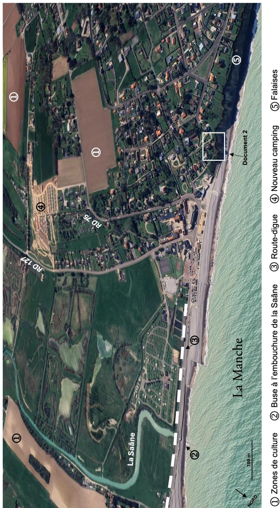
Vue aérienne de la commune de Quiberville-sur-Mer (19 avril 2023). [consulté le 1 er juillet 2024]