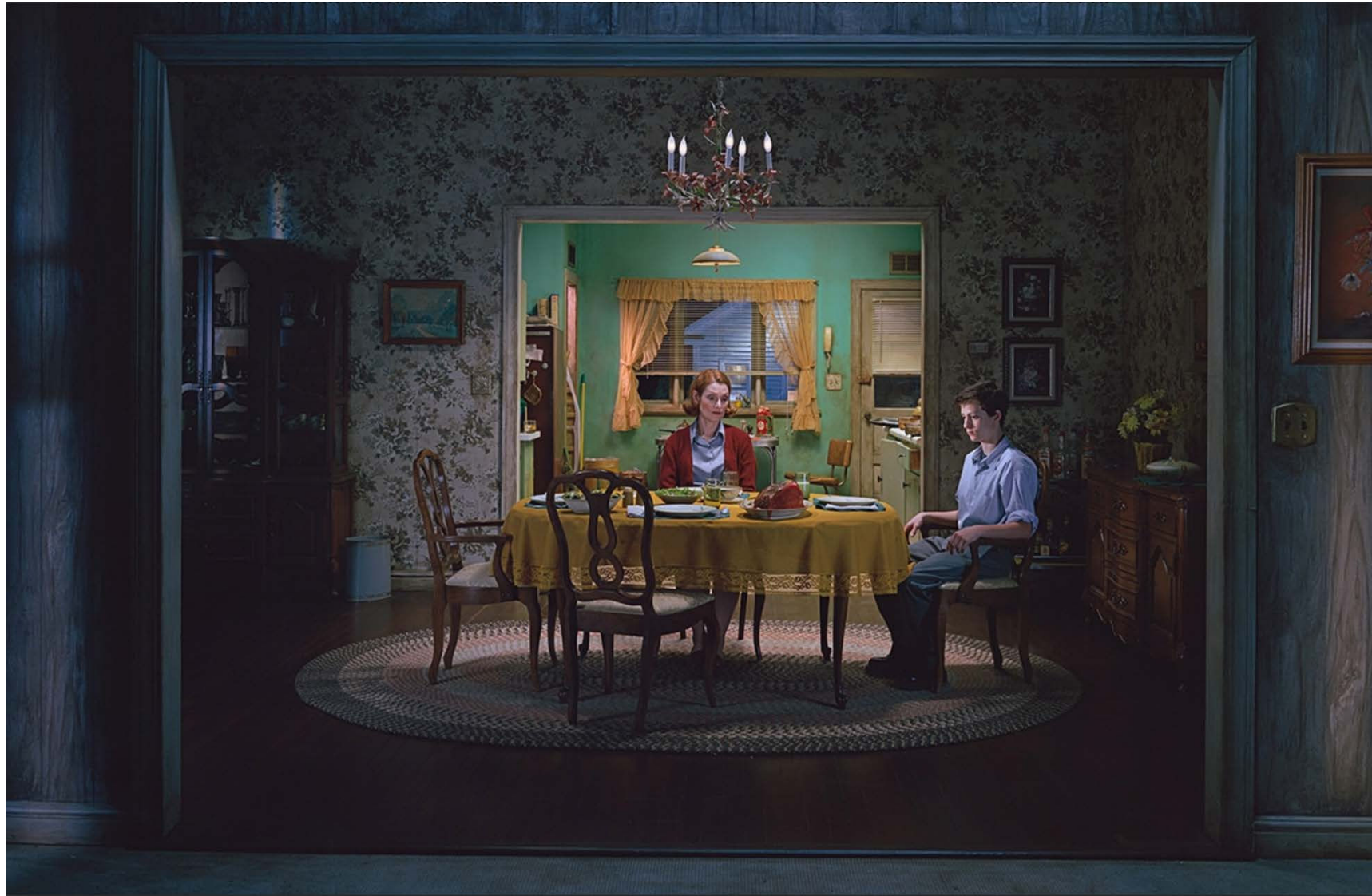
Gregory Crewdson, Untitled (Sunday Roast) (Sans titre [Le rôti du Dimanche]), de la série : Beneath the Roses (Sous les roses), 2003-2008, impression digitale, 144,8 x 223,5 cm. ALBERTINA Museum (Musée Albertina), Vienne, Autriche.