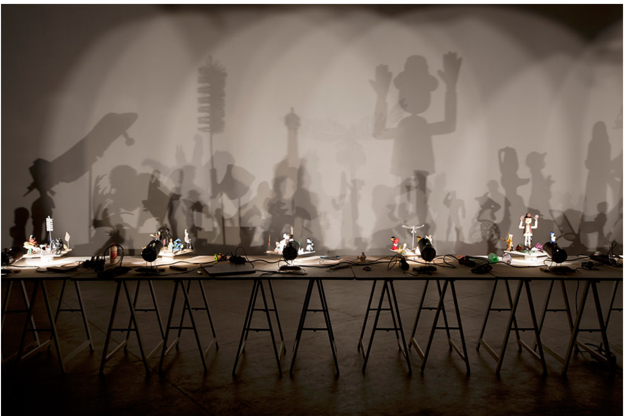
Hans-Peter Feldmann, Shadow Play (Jeu d'ombre), 2011, dimensions variables, bois, moteurs électriques, lampes, métal, céramique, plastique, papier, tissu, verre, jouets en fer blanc. Musée National d'Art Moderne (MNAM), Paris, France.