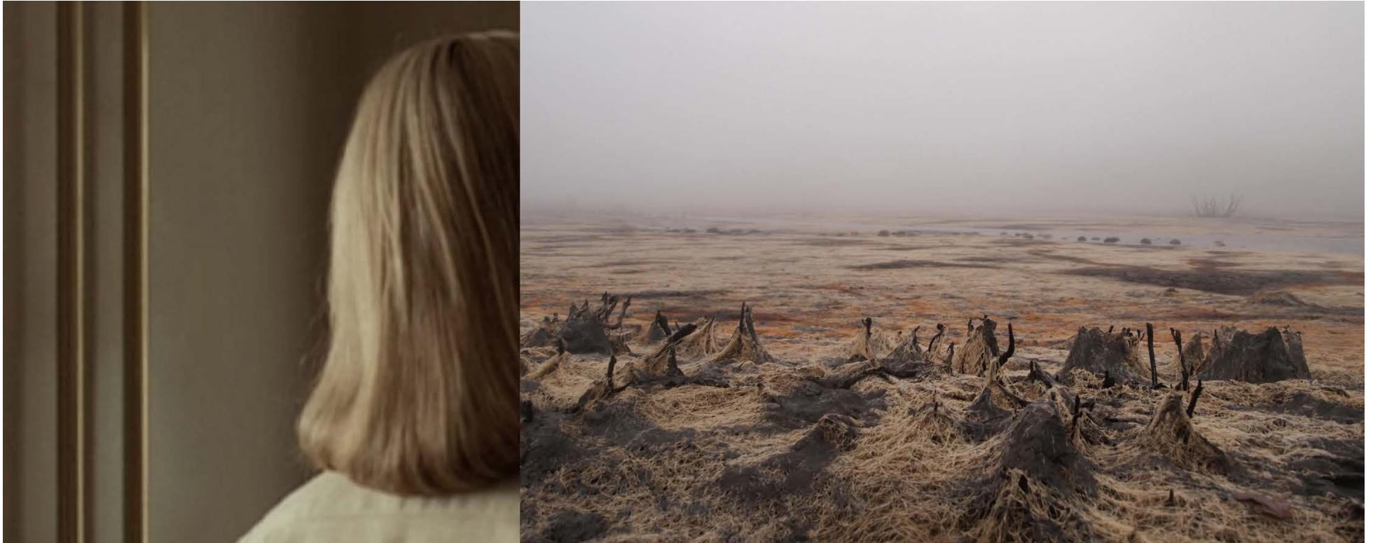
Anne-Sophie Emard, Kate , 2013, caisson lumineux, 50 x 125 cm. Collection FRAC (Fonds Régional d'Art Contemporain), Auvergne, France.