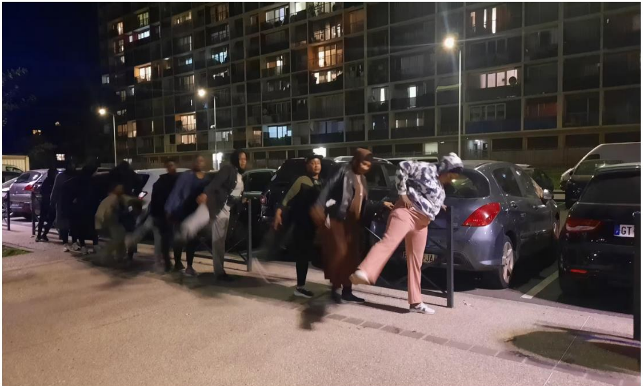
Exercices de mobilité, squat, renforcement musculaire sont au programme de cette séance de sport au pied des immeubles d'un quartier de Sarcelles, dans le Val-d'Oise.

A Sarcelles, les "mamans du quartier" se mettent au sport au pied de l'immeuble.